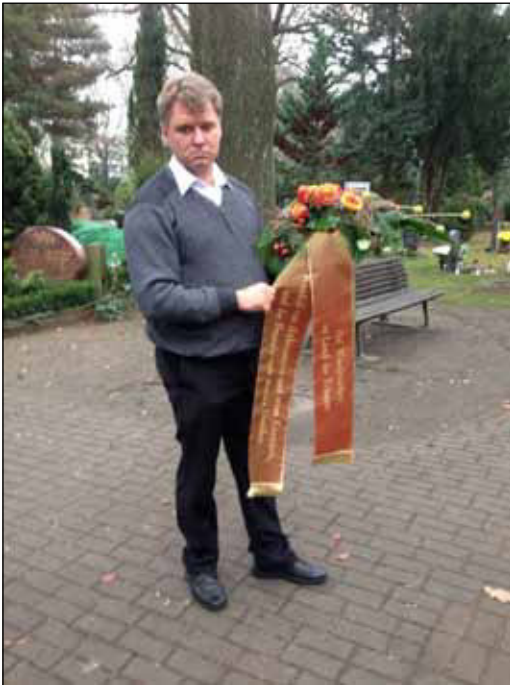
Trauergebilde von Dieter im Namen von Mosa.X.

17. November 2014, Montagabend – sozusagen ein ganzes ausgebranntes Lorenzo später – ist endlich alles klar, und es gelingt in allerletzter Minute und gerade noch so rechtzeitig, ein Trauergebilde für den nächsten Morgen zu bestellen. Das Gebilde selbst ist dabei noch nicht einmal das Problem, sondern vielmehr die Beschriftung der Kranzschleife. Wobei sich dabei natürlich auch sofort die Frage stellt, was denn überhaupt auf der Schleife stehen soll ... und es erweist sich als gar nicht so ganz einfach, da etwas wirklich Passendes zu finden!